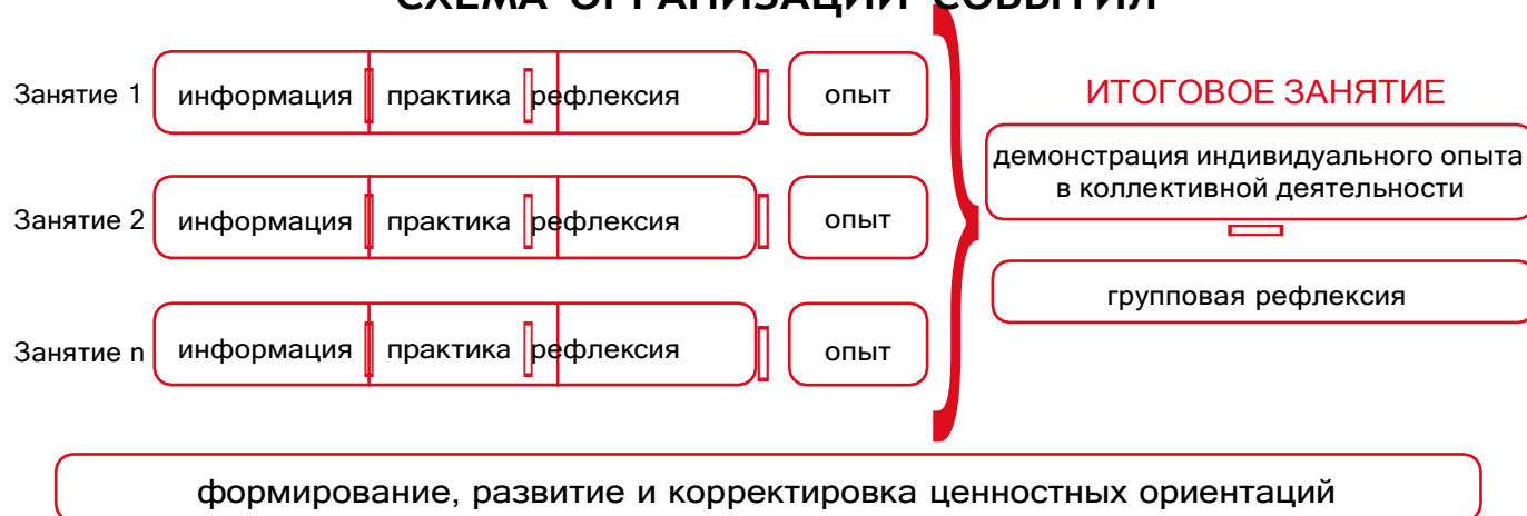
Рисунок 1 — Схема организации события

Таким образом, у пятиклассников происходит построение логической цепочки от собственного опыта проживания каждого занятия к ознакомлению с опытом других детей и к формированию общего отношения классного коллектива к прожитому ими событию.